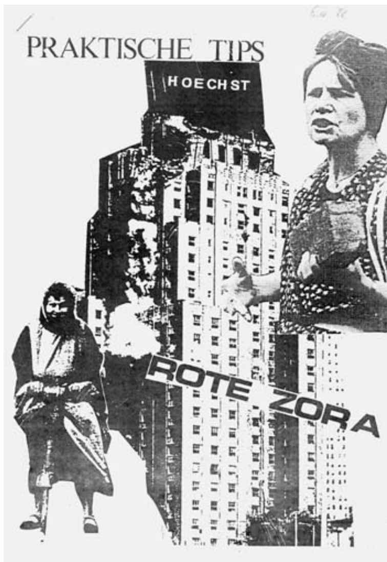
Rote Zora, Praktische Tips , 1990.

— Nola ikusten duzue zeuen burua: mugimendu feministaren partetzat, gerrillaren partetzat, edo biak aldi berean? Zuen ustez, zer lotura dago bien artean?